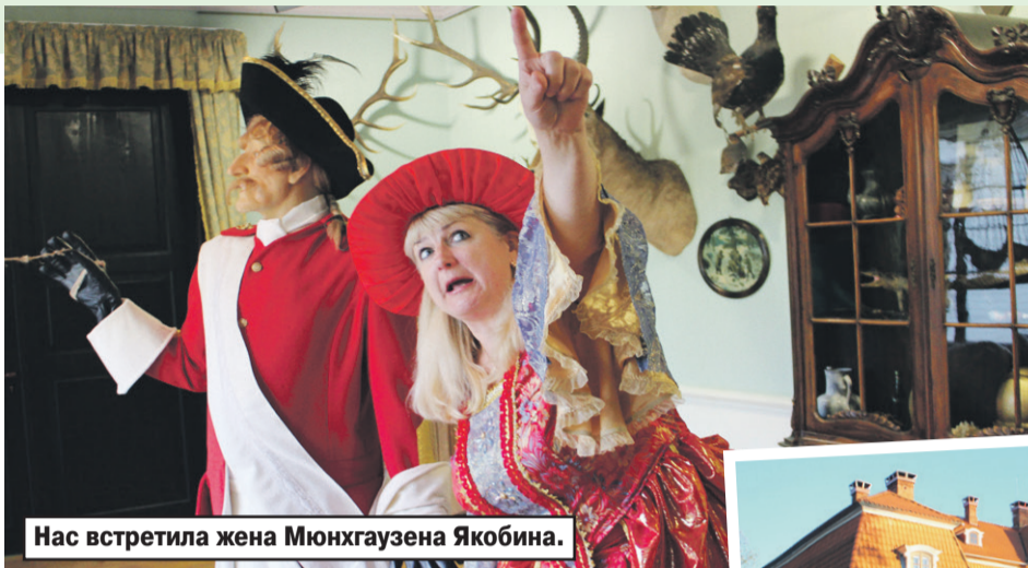
Нас встретила жена Мюнхгаузена Якобина.

Маршрут 3-й Саулкрасты — Дунте — Лиенупе — Игате