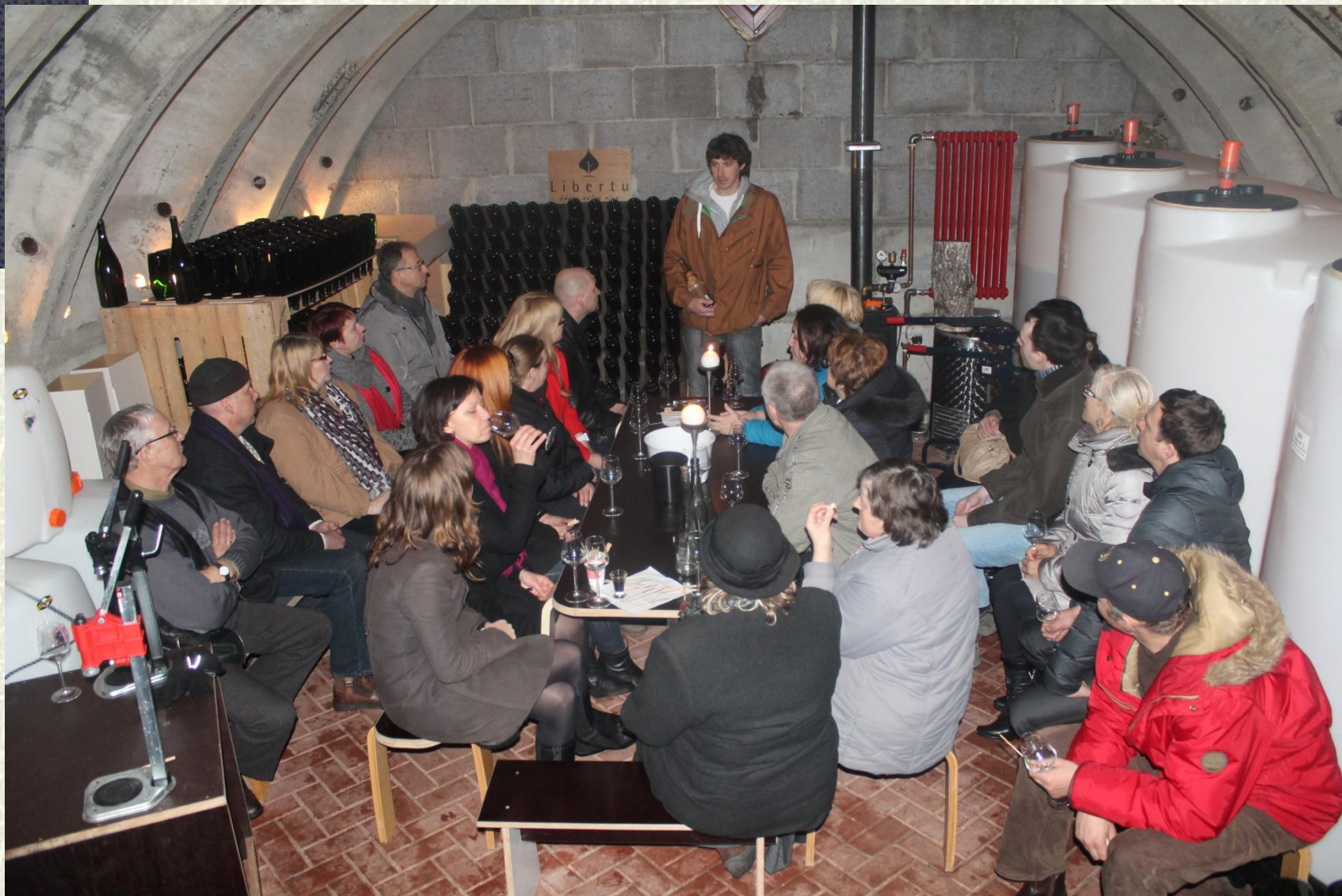
Bērzu sulas produktu baudīšana Ikšķilē